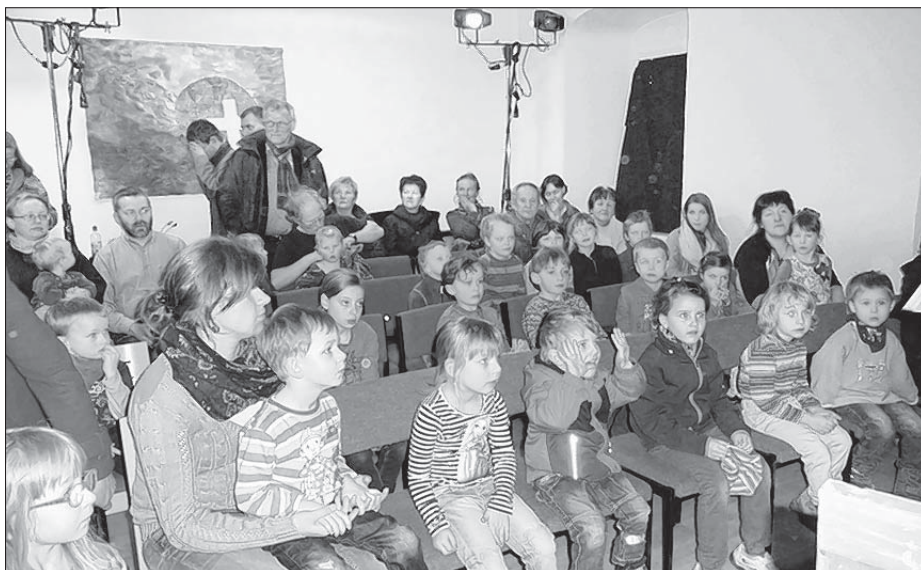
Klankodźiwadło wo małym wódnym mužem młodych přihladowarjow putaje.