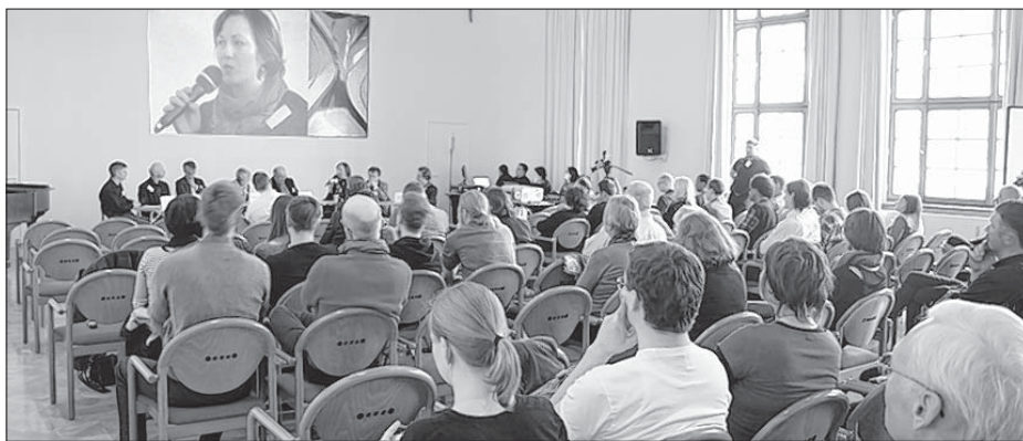
W Drježdžanskej kulturnej radnicu wotmě so serbski sympozij skladostnje pjećlětneho jubileja towarstwa „Stup dale“.

Wuradźowanja započachu so z předstajenjom wósom diskutantow na podiju,