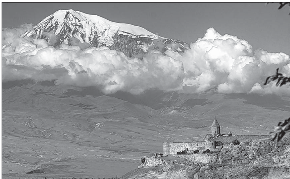
Hora Ararat, na kotrejž bě Noach z archu přistawiť, je narodny symbol Armenjanow, leži pak w džensnišej Turkowskej. Z klóštra Chor Virap maš wuhlad na Ararat.