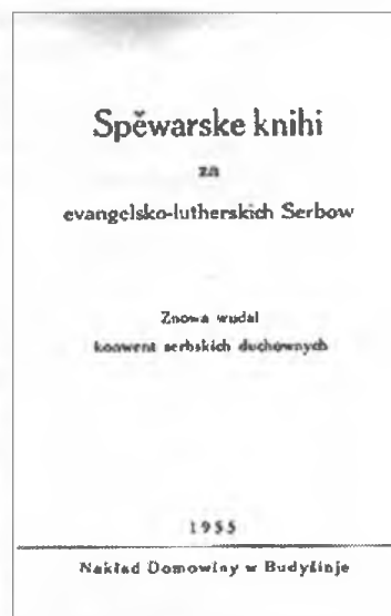
Přerňa serbska protyka z lěta 1855, zestajana wot fararja Roberta Rjedy w Hućinje – jědnaty a zdobom posledni nakład serbskeje biblije, wobstarany 1905 wot fararja Jurja Jakuba w Njeswaćidle – poslednje serbske spěwarske, wudate 1955 wot konwenta serbskich duchownych