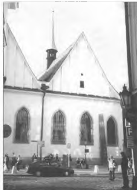
Betlehemska kapala na Betlehemskim naměšće w Praze

Při narańšej scěnje blisko hłowneho wotarja je sobuzaložer Hanuš z Milheima pochowany kaž tež někotři uniwersitni magistrojo ze swójbami. Čólna scěna kapaly pokazuje na Betlehemske naměsto a je dospołnje nowa, wona nadpadny z dwojimi wysokimi swislemi. Tři tamne scěny chowaja w sebi powostanki přenjatnych murjow. Narańšej scěnje přizamknje so mjeńše twarjenje, w kotrymž bě w přizemju drastkomora a nad njej w přenim poschodze bydlenje předarja. Wjetši džěl naměsta před