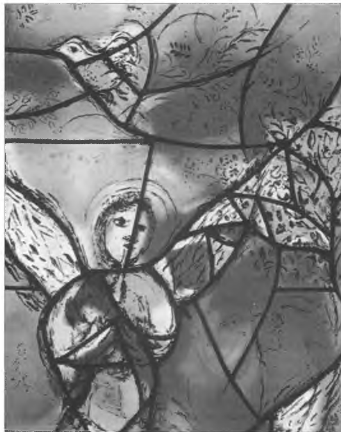
Jandžel pola Abrahama – wurězk z wokna Marca Chagalla w cyrkwi swj. Šćěpana w Malnzu