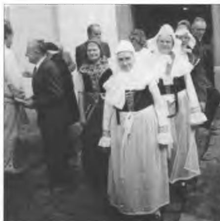
Wochožanki na serbskim cyrkwinskim dnu 1999 we Wochozach

Dojednachmy so, zo dyrbi so džěło we Wojerecach a w zafarowanych wsach na Horje, w Čisku, Židzinom a Spalach kaž tež we Łazu, w Delnim Wujězdze, w Nowym Měšće, w Klětnom, we Wochozach, w Bějeje Wodze a w Slepom dale wjesć. Při tym chcemy tež nowe puće hić, zo so kóžde štwórc lěta přihotuje Boža služba abo wosadne popoždnyjo, hdžež móža so druhe