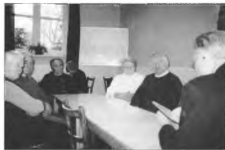
Na serbskim wasadnym popoždnu w Klětnom 1998

přednošował wo zajimawej temje našeho časa abo zańdženosće abo z dalokeho swěta, kiž smy sebi do toho wuzwolili.