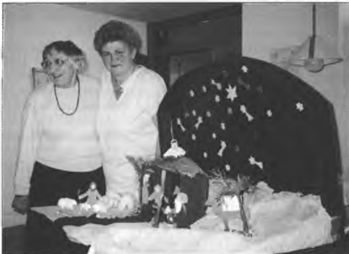
W Budyškej hladarni zwjeselichu so nad žłobikom, kiž běchu Bartske džěci pasilli.