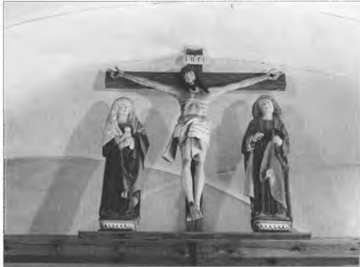
Skupina z křižowanym w Njeswačidskej cyrkwi

Ale w susodnej Njeswačan wosadže dyrbeše młoda žona po kwasu lédma do noweho domu přišedši so swoju holansku narodnu drastu slec a na wše časy do lódky schować. Jako mi tole rozprawješe, bě jeje dušina bóľ spóznac. Dokelž dalje wuši naju rozmołwu styšeć njemóžachu, zwaži sej tež serbsce rěćec.