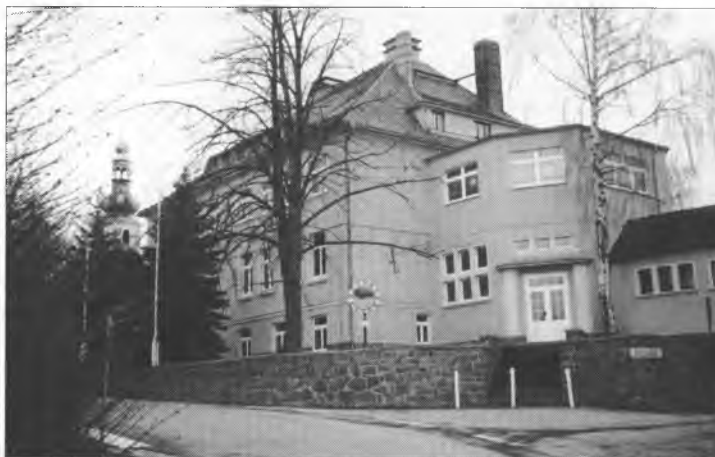
Šula w Bukecach – nastanje tu ewangelska srjedźna šula?

Po dotalnych předstawach ma so tež serbska problematika we wučbje wobkedźbować. Na kajke wašnje měto so tole stać, njeje hišće wěste. By pak jara derje było, hdy by so podawała serbsčina a hdy bychy so zaprijeli bohate serbske stawizny wosady. Ze serbskeho stejišća móže so přede-