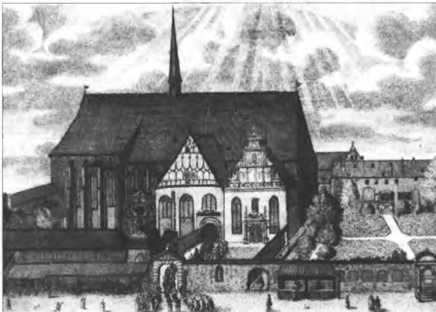
Uniwersitna cyrkej w Lipsku, w kotrež wotměwachu so prawidlownje zwučowanja serbskich přédowanjow

započa – mějo to za zakład wšeje wědomosće – hnydom propedeutiski, to je řečnoteoretiski, kursus přewjesć. Tuta tendenca so konsekwentnje dale wjedžeše, jako so w běhu přenjeje polojcy 19. lětstotka mnohe podtowarstwa Lužiskeho přédarskeho towarstwa založichu, kaž na přikład filologiske, psychologiske, eksegetiske abo katechetiske towarstwo. Serbski wotdžěl přetwori so w tutym zwisku tohorunja na podtowarstwo, kotrež mjenowaše so Sorabi-