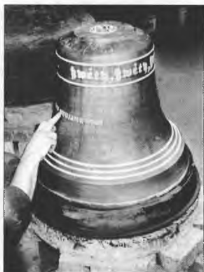
Před lećom w Lauchhammer-skej lijerni