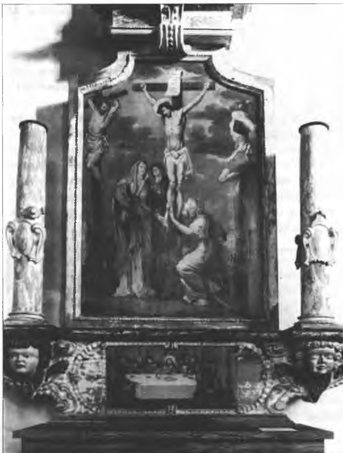
Zbytki wołtarja Serbskeje cyrkwyje w Złym Komorowje

a zemski wolij. Myslimy tež na přeměnenje klimy a z tym zwisowace problemy. Můžeme tež na atomowe bomby myslić a na to, zo móžeja w rukach diktorow zničić cyły swět. Prašamy so tež druhdy, što drje w přichodze na nas přińdže. Někotryžkuli za přichod žadyn puć wjac njewidzi.