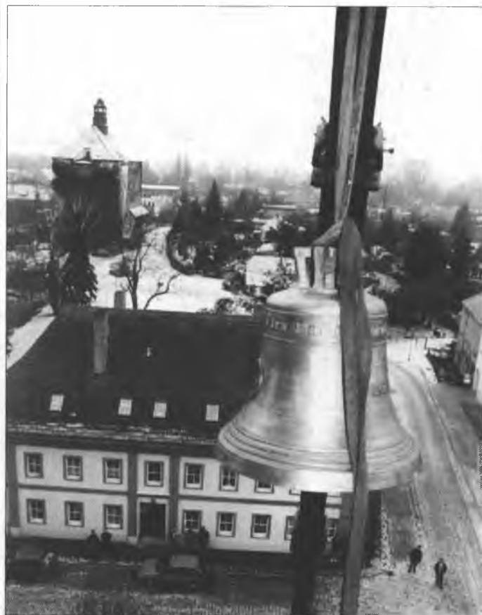
Zběhanje serbskeho zwona na wěžu Picnjanskeje cyrkwe