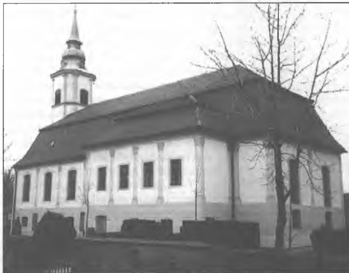
Cyrkej w Delnim Wujězdze

Na dochody słabe swójby móža, kóžda w svojim zwjazkowym kraju, wo pjenježnu podpěru prosyć. Sakska płaći na př. 15 hr na wosobu a noc.