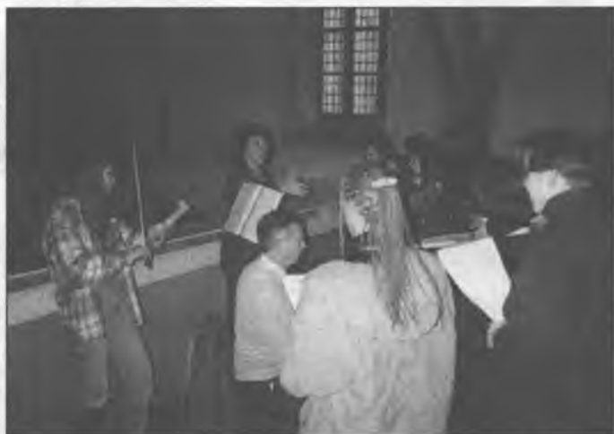
25.12.1995 w Serbskej cyrkwi w Choćebuzu. Delnjoserbski džěcacy chór a měšany chór „Łužica“ stej hodowne kemše zaso ze serbskimi hodownymi kěrlušemi wobrubitoj