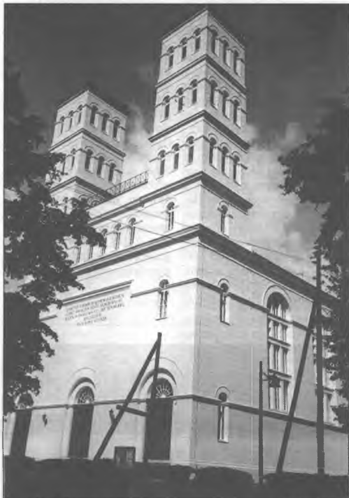
Cyrkej w Tšupcu