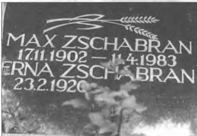
Row ludoweho basnika na Poršiskim kěrchowje