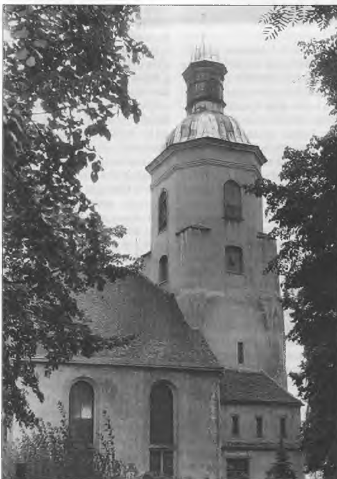
Cyrkej w Hrodzišču