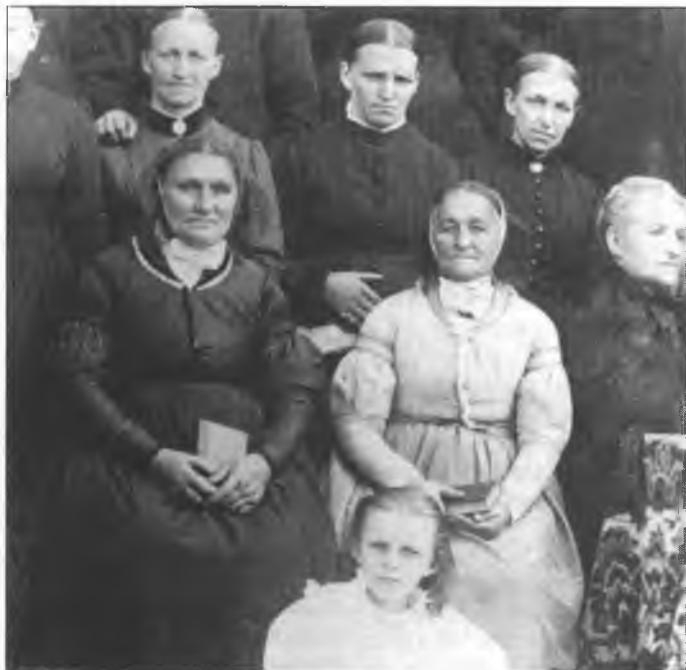
Na kóncu zašłego lětstotka chodžachu někotre žony Hrodziščanskeje wosady hišće w serbskej drasće

bě předsyda Serbskeho mision-skeho towarstwa a wot 1906 do 1921 předsyda serbskeje předarskeje konferency, kotrež tehdy na 30 duchownych přislušeše.