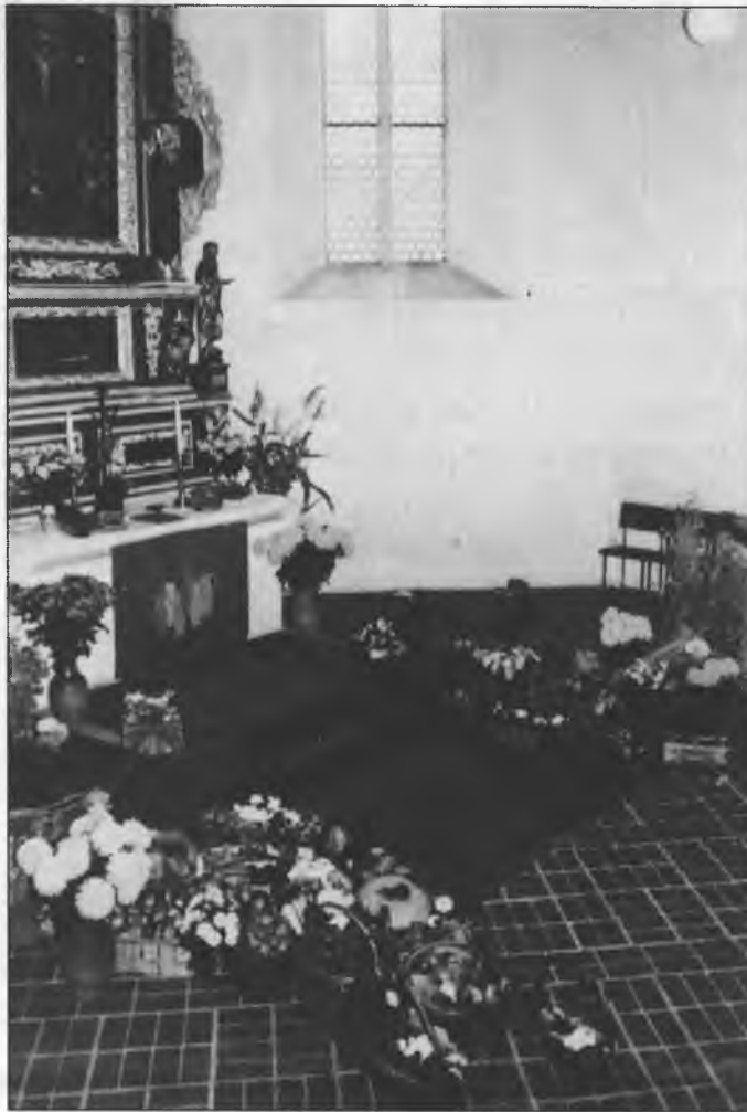
Žnjowy džakny swjedžen w Michałskej cyrkwi