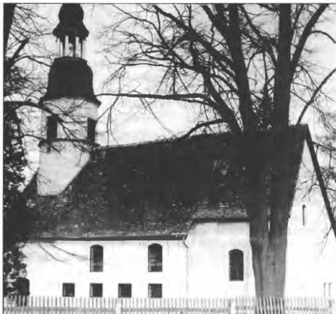
Cyrkej w Kózlach