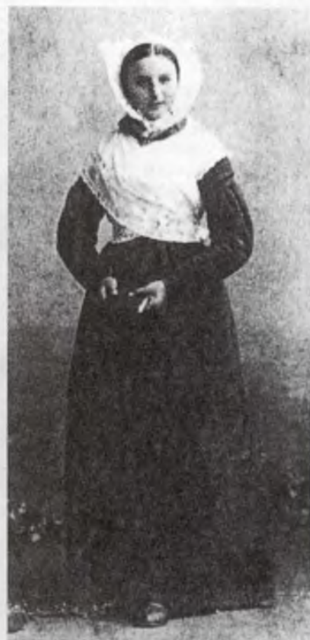
Pačerska holca w křidlatej kapičce z Kubšic něhdže na kóncu zašeho lět- stotka