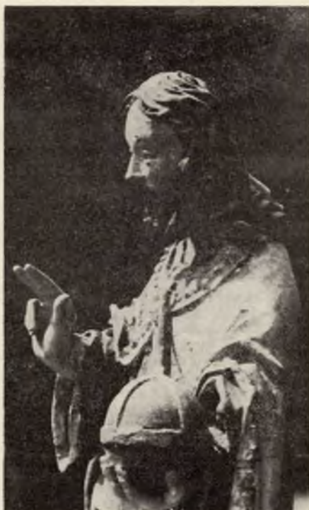
Klětka Michalskeje cyrkwyje w Budyšinje

Boha měj za Knjeza, nic pak knjeza za Boha.