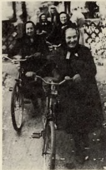
Serbowki na puću k delnjoserbskim kemšam