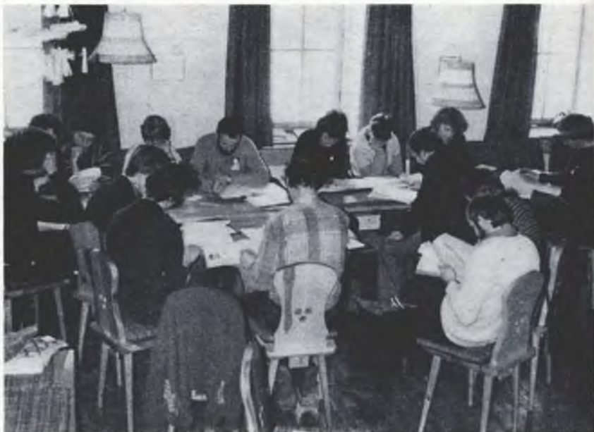
Jedna ze skupinow měroweho seminara při džele

Rakecy: Rozprawa za lěto 1980: Křćenjow 41 (44), konfirmandow 36 (33), wěrowanjom 19 (12), pohrjebow 36 (40), na božim wotkazanju wobdžěli so 2197 (1543) wosadnych. Najlěpje wopytane kemše běchu: 6. jan.: wukonc CFK-seminara wo Bonhoefferu (384), 4. meje: konfirmacije (568), swójbne kemše (wopomnjeće křćenjow 364) a patoržicu (607). To woznamjenja přerězk wopytowarjom 121 wosadnych na njeźdelnych kemšach. Dohromady bě sydow božich službow, na kotrychž wobdžěli so wjacje hač 250 wosadnych! Zběrkow za wosadu mějachmy 21 648, darow 7970 hr. Dochodow mějachmy dohromady 84 406 hriwnow a wudawkow 80 515 hr.